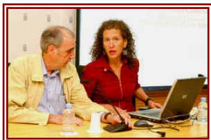
Ellos, juntos y revueltos

La Evaluación General de Diagnóstico 2009, realizada a alumnos de 4º curso de Primaria por el Ministerio de Educación para conocer el nivel de adquisición de competencias básicas en Matemáticas, Lengua Castellana, Conocimiento e Interacción con el Mundo Físico y Social y Ciudadanía, ha dado un varapalo impresionante a la Consejería de Educación del Gobierno Canario . Volvemos a arrojar los peores resultados, sólo superados por los de Baleares, Ceuta y Melilla. El estudio es relevante porque, pese a todos los intentos del Gobierno Autónomo por maquillar el fracaso escolar y la ruina educativa en las islas, en cuanto se nos hace una evaluación externa la